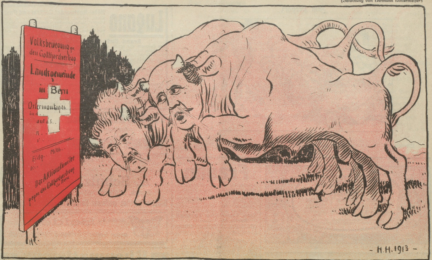
Die Direktion der Bundesbahnen hat verboten, daß in den Bahnhöfen das Plakat des Aktionskomitees gegen den Gotthardvertrag angehängt werde