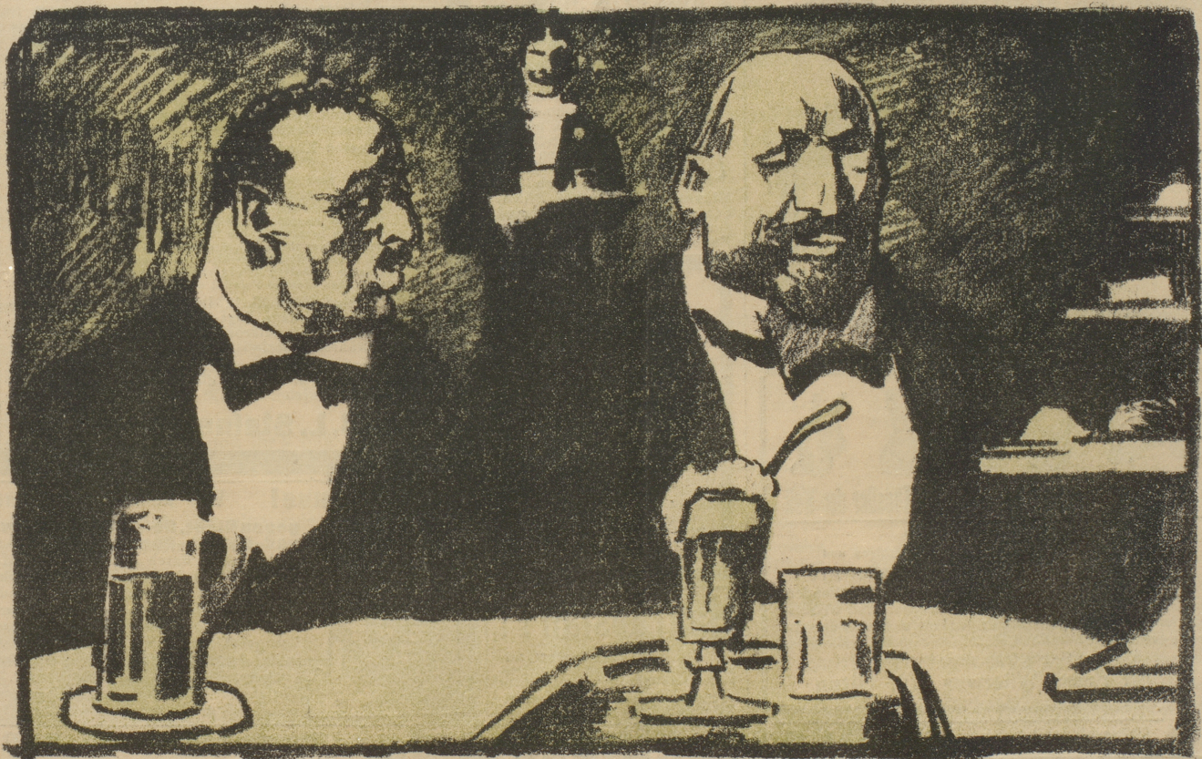
„Was gehen uns die Berichte an — unser Weizen blüht.“