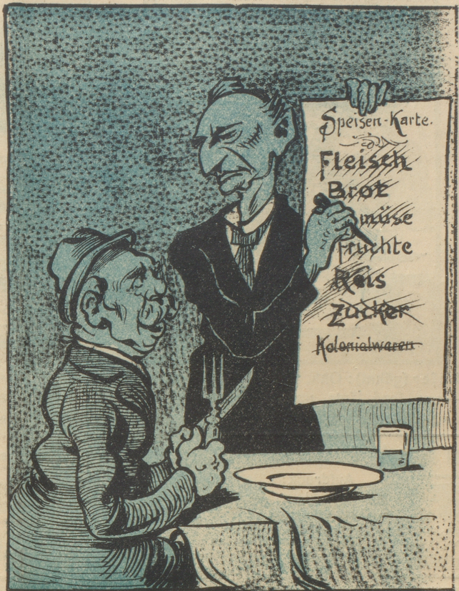
Greg führt ihn auf Grund der Speisekarte.