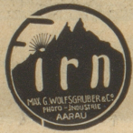
Photo-Artikel sind unübertroffen. Zu beziehen durch Photo-Handlungen.

TANZ Semmler-Rinke Rämistr. 4 (Bellevue-Platz) KURSE Einzelunterricht - Repetitionen