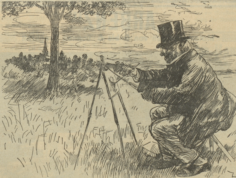
Freilicht-Malerei. „Ich weiß nicht, was Leonardo da Vinci so Schweres darin gefunden hat!“

am vorteilhaftesten im Pianohaus P. Jecklin Söhne Ob. Hirschengr. 10 Zürich 1.