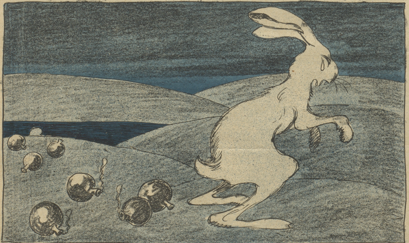
Der traurige Osterhase.