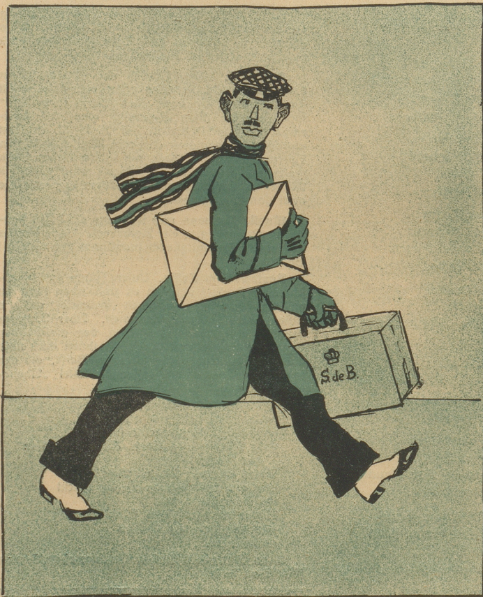
Ein richtiges Märchen ohne Prinz wär' nicht pikant, Hier naht sich Sigtus mit dem Friedensbriefe in der Hand.