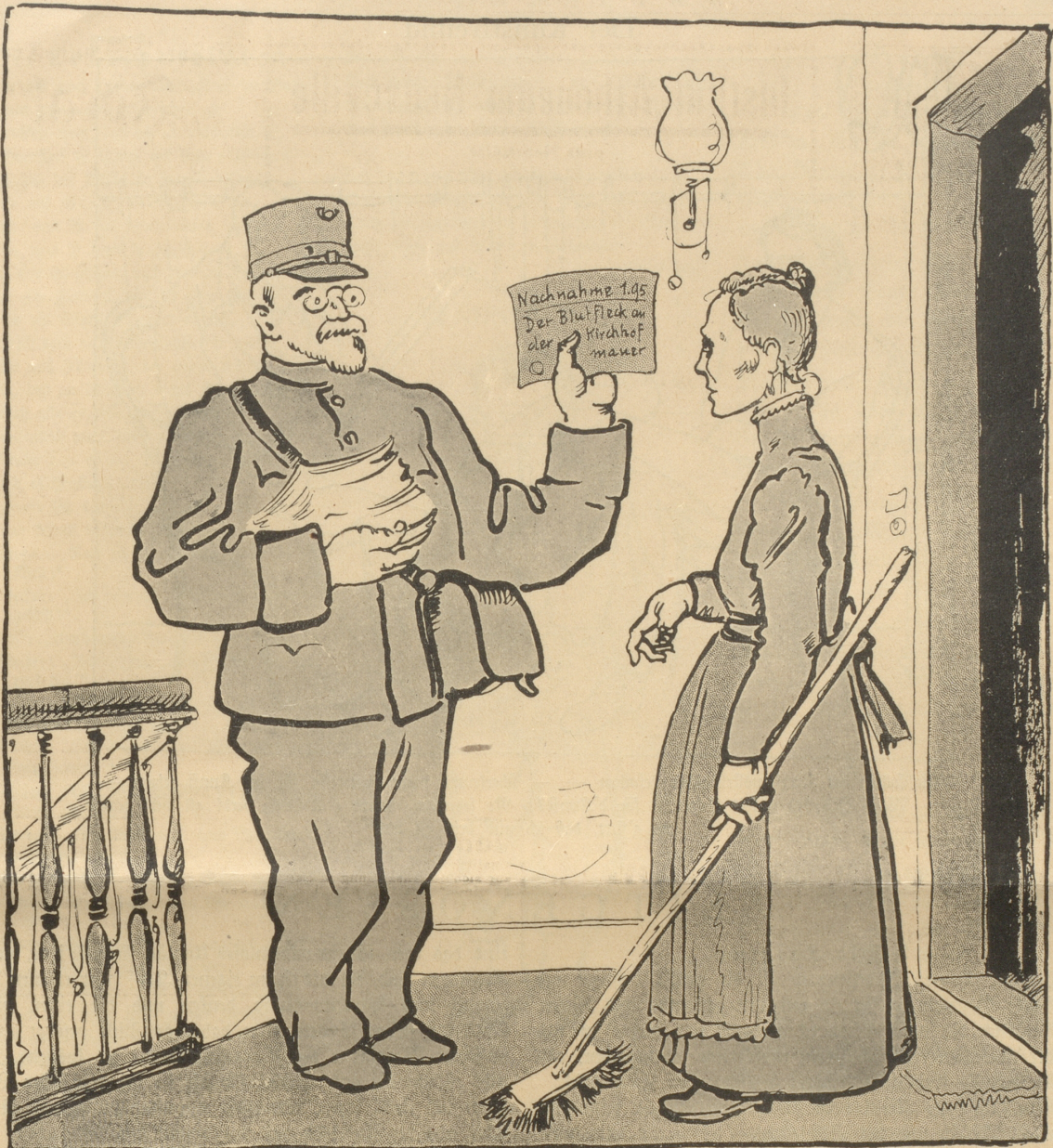
Postfaktor: „Kaufen Sie sich für das Geld lieber ein rechtes Nachtessen und holen Sie sich ein gutes Buch in der Volksbibliothek.“