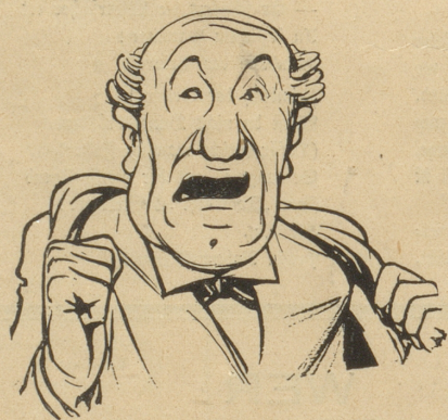
jedefalls wieder amene Großtrot, wo z'breitspurig zum Fenster use g'redt het“. R. G.