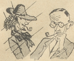
Will man ein bekannter Maler werden, so breche man mit der Vergangenheit.