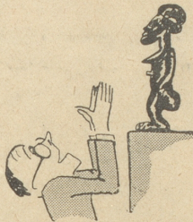
Man schwärme für die Negerkunst.