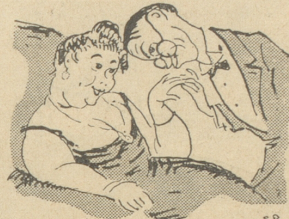
und daß die Kunsthändler Frauen haben.