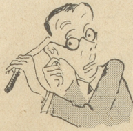
Man schneide sich wie van Gogh das Ohr ab.