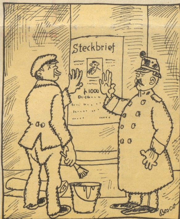
„Nüme nötig, mer hände!“ „Die werdet jekt no akäubt!“