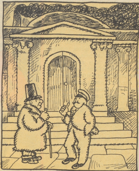
„Mit dere Kremation isch hüt nüt, de Ma isch nu schitob gfi.“ „Das isch jekt z'pot, es isch scho gheizt.“