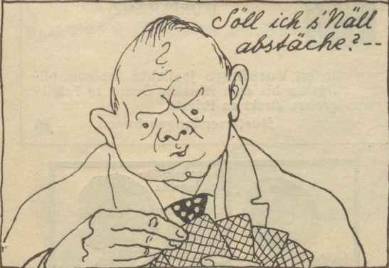
Aus dem von Paul Leimbacher und Paul Altheer im Verlage Bretknecht & Co. in Zürich herausgegebenen „Sabbüchli“ mit Zeichnungen von Fritz Wescovits.