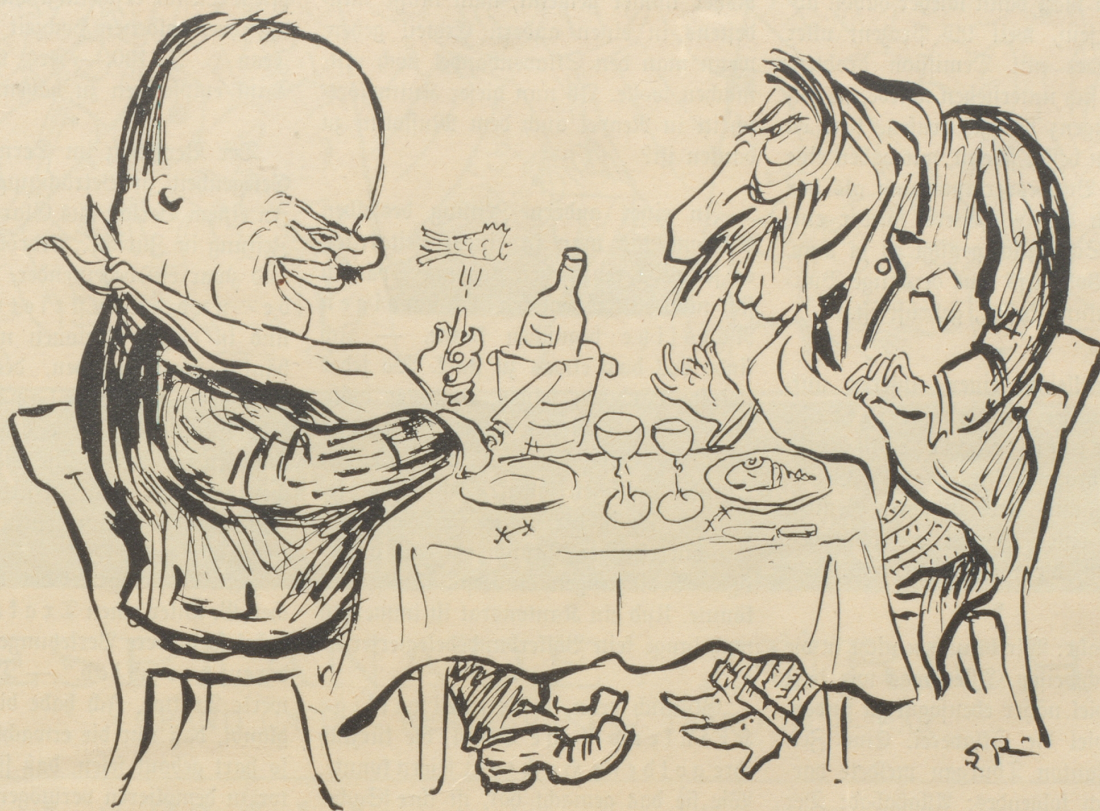
„Die Liebe geht durch den Magen“

für das große Unternehmen gründlich vorbereitet.“ So las man in der Zeitung über Gertrud Ederle. Merkwürdig ist nur, daß andere Mütter noch weit mehr als zwei Kinder gestillt haben und trotzdem nicht einen Meter weit schwimmen kön-