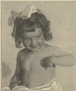
„Die Kleine, vordem etwas blass, ging auf wie ein Röschen. . . Schliesslich ovomaltinte die ganze Familie.“

In diesem Sinne bedeutet eine Tasse Ovomaltine ein Fest für Mund und Magen. Hochwertig, leicht verdaulich, angenehm von Geschmack, führt sie dem