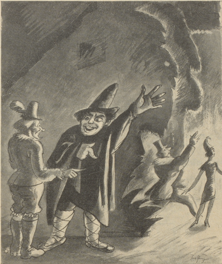
„Spielen Sie nicht mit, Signor Italiano?“ — „No, ik spiele bloß hinter die Kulissa.“