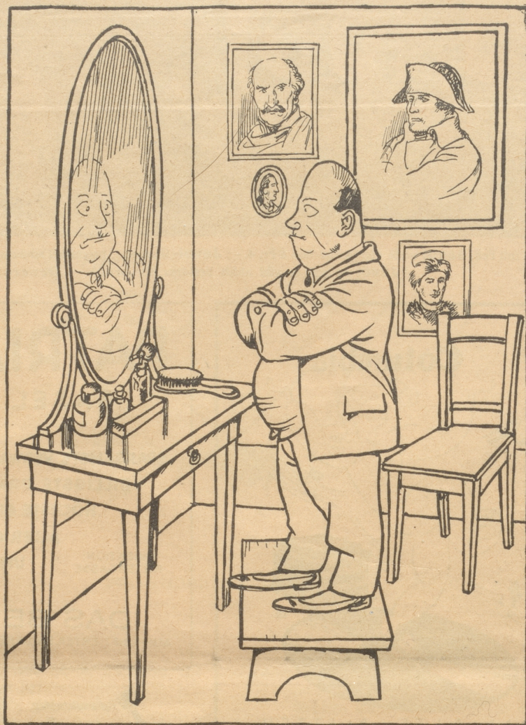
„Verzweifle nicht bei den Schwierigkeiten ein großer Mann zu werden.“

Tuxbury Old Hall liegt abgelegen — acht Kilometer von jedweden Ort entfernt. Am Bahnhof war kein Fuhrwerk zu finden, so blieb mir nichts übrig, als zu gehen und meinen Handkoffer zu tragen. Es war fast dunkel, als ich mein Ziel, ein sehr großes Haus inmitten eines ausgedehnten Parkes, erreichte. Ich möchte sagen, daß dies Haus alle möglichen Zeitalter und Stilarten in sich vereinigt. Die halb aus Holzfachwerk bestehende Bauart der Elisabethianischen Zeit, verbunden mit dem Säulenbaustil der Vie-