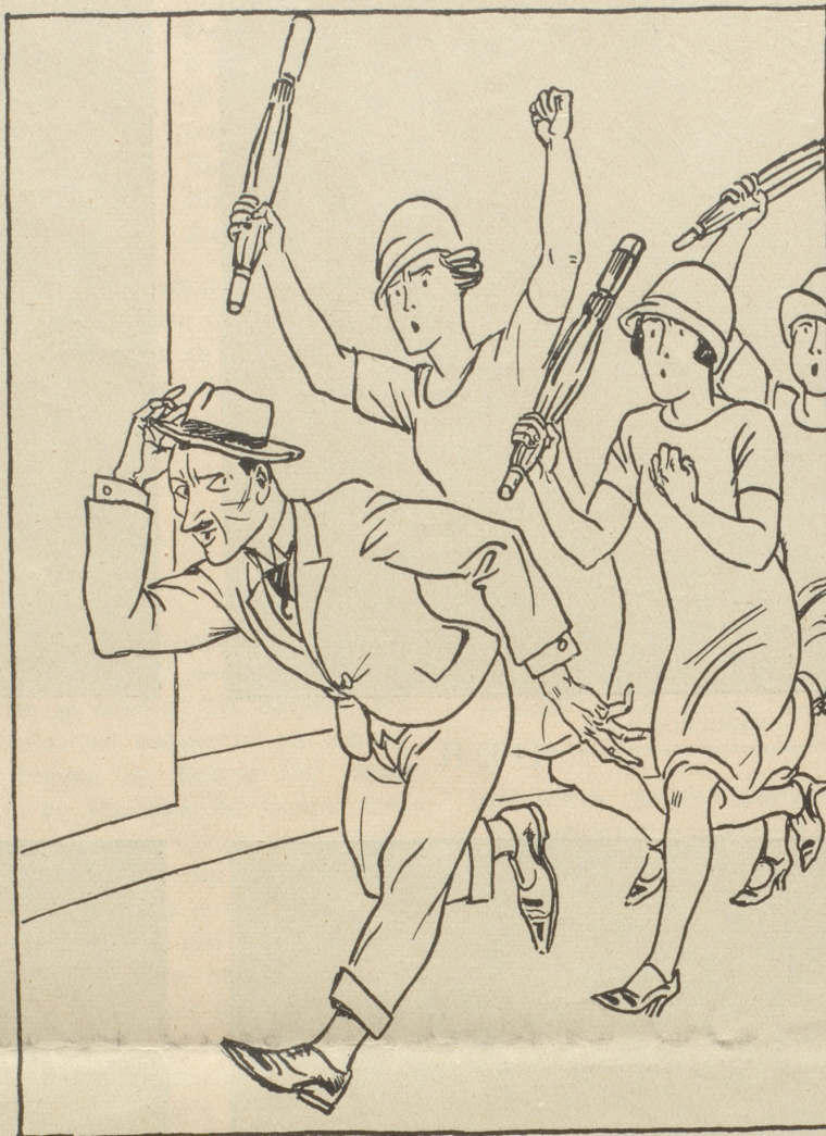
Warnung vor übereilten Eheversprechungen.

Als die 137 Entschuldigungen endlich verlesen waren, wurde das Wort der Kommissionsreferentin des zu behandelnden Pelztierschutzgesetzes gegeben. Da dieses Gesetz aber schon bereits viele Jahre, ja selbst