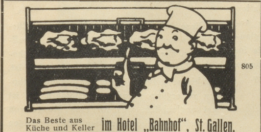
Das Beste aus Küche und Keller im Hotel „Bahnhof“, St. Gallen.

St. Gallen Bahnhof-Bufferet Gut gepflegte Küche. — Reelle Weine. Pilsner-Ausschank. Mit bester Empfehlung O. Kaiser-Stettler. 687