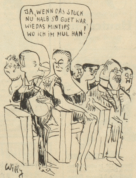
Die neuen, köstlichen Erfrischungs-Bonbons Mintips sind erhältlich in eleg. Etui zu 20 Cts. und offen nach Gewicht.