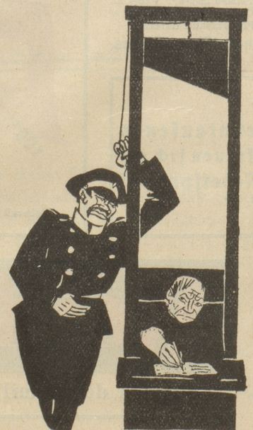
Wie sich Pilsudski seinen Parla- mentarismus vorstellt! Notenkraker

Mit einem fast unvergleichlich harmonischen, förmlich leidenschaftlich visionären Paukenton schliesst die Schilderung, die Romain Rolland in seinem Vorwort allzu höflich eine ehrfürchtige und ergreifende, der Autor aber einsichtsvoll eine unzureichende nennt und die wohl nur entstehen konnte, weil des bekannten russischen Kulturhistorikers Rechte nicht wusste, was die wildgewordene Füllfeder tat. (Jos. Ehling.)