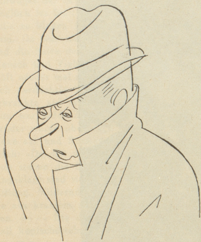
Es sieht trüb aus —