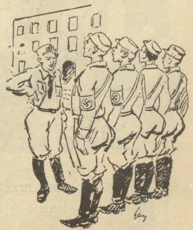
Mädchen in Uniform

„Du Schatz — wie viel Bomben kann eigentlich ein Zeppelin tragen?“