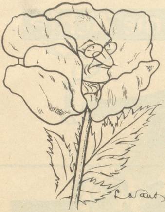
GANDHI . INDIA