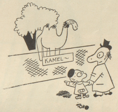
«Nimmt es das Tier nicht übel, wenn man ihm Kamel sagt?» Ric et Rac