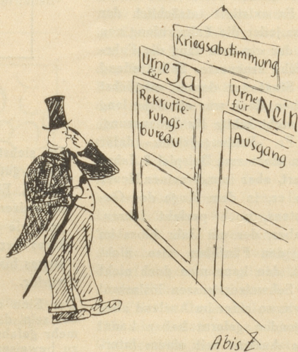
Der Rüstungsmagnat: «Ja, wens keinen dritten Weg gibt, dann nein!»