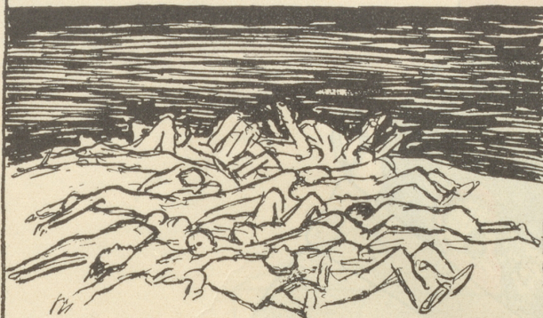
Eine Stadt wird bombardiert — — viele Tote ...