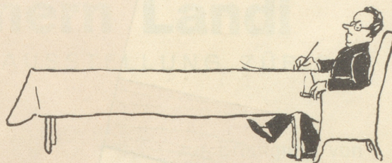
... eine Regierung protestiert