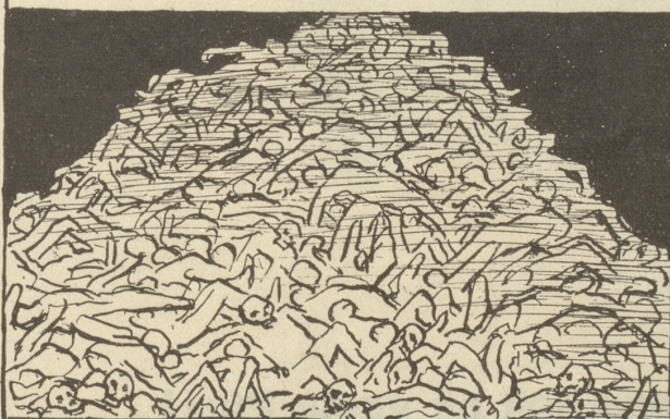
Eine Stadt wird bombardiert — — unzählige Tote ...