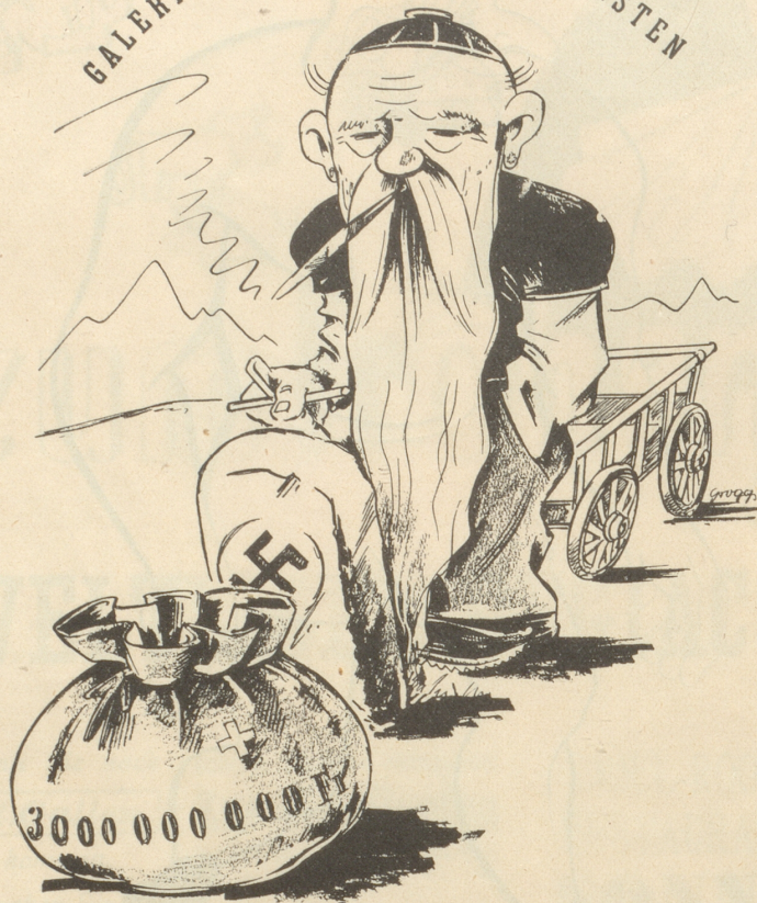
Der gute Mann, der immer noch etwas abholen möchte!