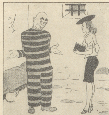
Sträfling, zum Besuch: «Entschuldigen Sie, bitte, daß ich grad im Pyjama bin!» (Il 420, Florenz)

Wenn sich auch meine Freude am leckeren Fleischschmaus schon etwas reduziert hatte, so begab ich mich frühzeitig mit neuem Mut wieder auf die Fahrt. Und siehe, der richtige Pöstler, ein freundlicher, alter Mann, stand schon hinter dem Schalter. Er plauderte vergnügt von den Genüssen dieser Welt im allgemeinen, von einem guten Schmaus im besonderen, und daß er im übrigen keine Ahnung hätte, wie solches Schweizerfleisch eigentlich schmecke. Natürlich versprach ich ihm ein «Versuecherli» davon. Eilfertig erklärte er mir den weiteren Fortgang meiner Angelegenheit: zuerst eine Mitteilung an die Zollbehörde, die er mir zuliebe gerne schreiben wolle, und dann sei nur (!) noch die Einfuhrerlaubnis vom städtischen Veterinäramt einzuholen. Mir schwindelte — — —. Als ich wieder zu Sinnen kam, schüttelte ein Bureaudiener meinen Arm, hielt mir ein Bleistiftgeschreibsel unter die Augen und führte mich hinaus. Willenlos folgte ich durch enge, winklige, schmutzige Gassen auf und ab zum