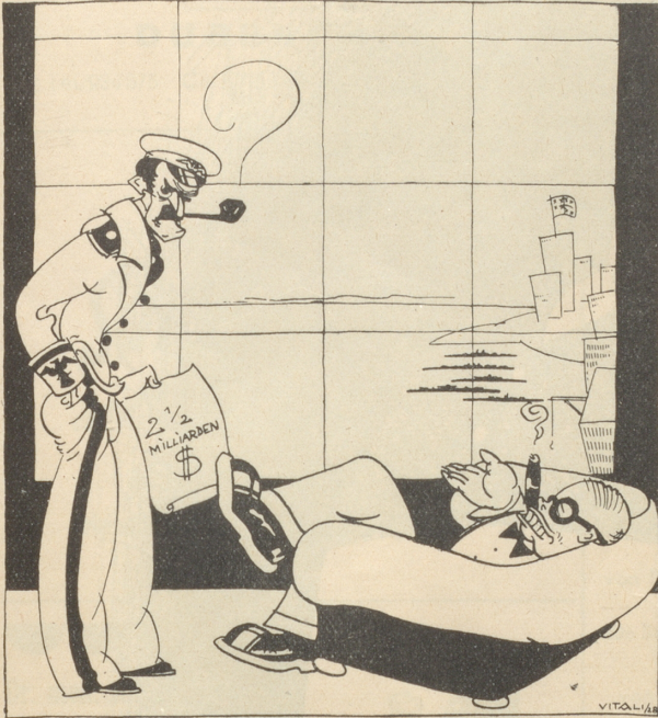
Mr. Wallstreet: „Für zweieinhalb Milliarden Kriegsschiffe? — Das braucht Zeit! Drahten Sie eine neue Friedensbotschaft nach Europa.“