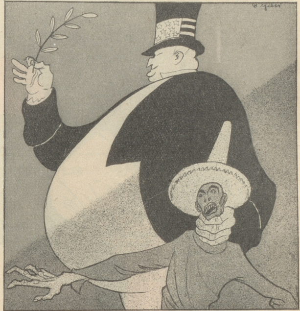
Also steht geschrieben: Die Rechte soll nicht wissen was die Linke tut.

schmecken. Kauend ließ ich die eben abgeschlossenen Lauf- und Wartezeiten in Gedanken noch einmal vorüberziehen, und dann machte ich die Rechnung in Schweizerfranken.