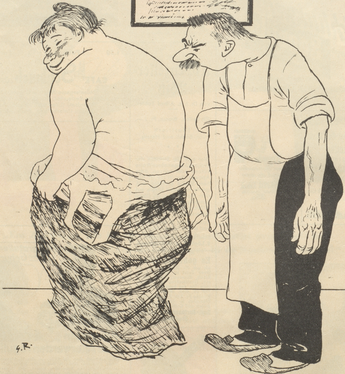
Ein schwieriger chiropraktischer Fall: