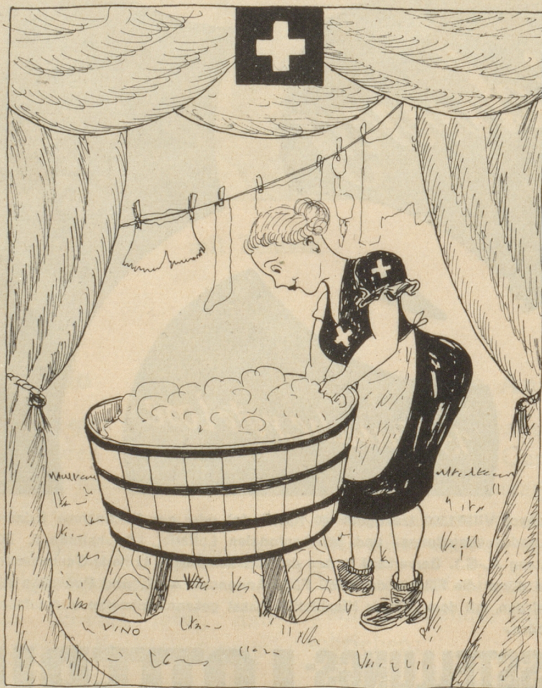
Das Schweizer Dienstmädchen — eine Rarität!

Trostpreis: E. Waeber, Seuzach-Winterthur