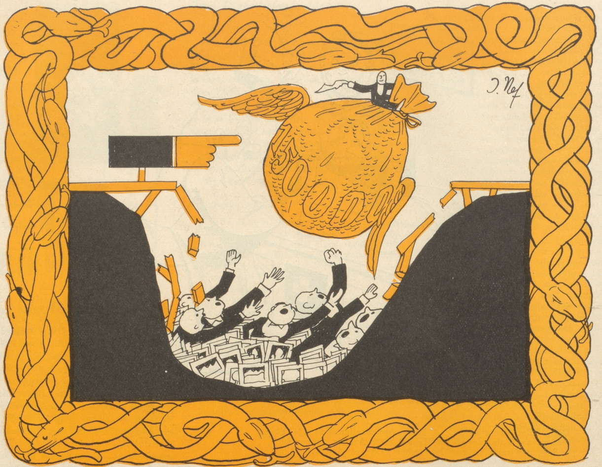
Die Stadt Biel hat einem Händler aus Antwerpen für eine Bildersammlung 150 000 Fr. bezahlt. Die Sammlung hat einen Wert von höchstens 25 000 Fr.