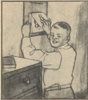
„Oh, wie schad, jetzt wird's bald regnen. Auf dem Kalender steht es: „Auf trocknen Mai kommt nasser Juni herbei.“