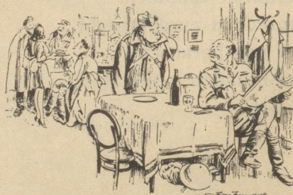
«Hat sie verstanden, daß ich Huhn-Schenkel will?»

Nach dieser Rede versank das Maultier in Trübsinn und ist seither trübsinnig geblieben. Peter Kilian