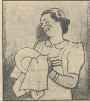
„Es ist aber doch etwas an den alten Bauernregeln. Wir wollen lieber annehmen, dass das Wetter schlecht wird und vorsorgen.“