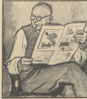
„Ach, Unsinn! Wenn der Hahn kräht auf dem Mist, ändert das Wetter oder es bleibt wie es ist.“