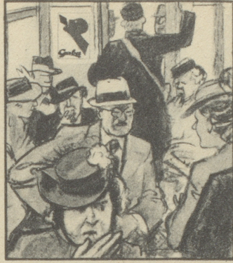
„Hören Sie, wie alles um uns herum hustet; da werden wieder viele bei der Probe fehlen.“