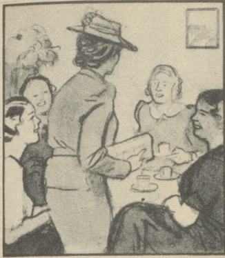
„Ich muss gehen, sonst komme ich zu spät zur Chorprobe.“ — „Nimm Dich in Acht, es weht ein rechter Grippewind.“