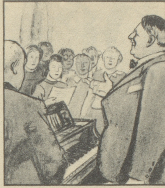
„Ich freue mich, dass wir vollzählig versammelt sind und hoffentlich alle gut bei Stimme. Haben Sie meinen Rat befolgt?“