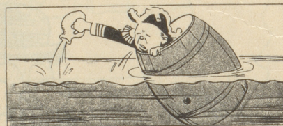
Die britische Tonnage ist unerschöpflich — Deutsche Satire aus dem «Kladderadatsch»