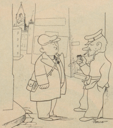
In der Großstadt Züri

Willi: «Jo, aber da heft desäb Kantonschemiker em Land dänn schwer gschadet, wo d'Schnapsfälschig us-gschwätzt het!» Bo.