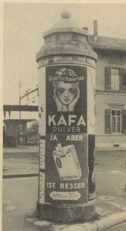
Der unfreiwillige Humor kommt auch auf Liffah-Säulen vor.