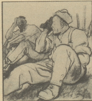
Natürlich kommt man bei der ungewohnten Arbeit ins Schwitzen, und bei dem rauhen Winterwetter ist es dann zu einer Erkältung nicht mehr weit.