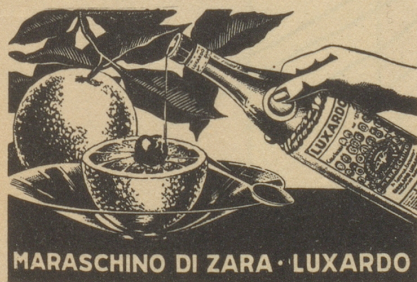
MARASCHINO DI ZARA · LUXARDO

Langsam und vorsichtig tappe ich durch die pechschwarze Nacht. Petrus hat verdunkelt und wir da unten auch! Noch können meine Augen nichts unterscheiden. Doch langsam bekomme ich Mut und stapfe mit schlafwandlerischer Sicherheit munter drauf los, als ob ich meiner Lebtag nichts anderes als dunkle Pfade gesucht hätte. Geschickt zirkle ich mich zwischen den schwarzen wandelnden Gestalten durch. Glücklicherweise haben sich die meisten von ihnen ein leuchtendes Zeichen an den Bauch gesteckt. Ich beschleife sogleich, zur reibungslosen Abwicklung des Trottoirverkehrs auch mein Scherlein beizutragen und mir bei nächster Gelegenheit ebenfalls ein solches Glühwürmchen anzustecken. Vorläufig aber freue ich mich heimlich über die schwarze, schützende Hülle, die mich umgibt. Man stelle sich doch vor: Da durchwandle ich eine sehr belebte Straße, eine Straße, in der man sonst mit todernster Miene und stolzen Ganges einherschreitet, in der man seine Mitmenschen mit kritischen Blicken zu messen pflegt und von ihnen mit oft noch kritischeren Blicken gemessen wird. Auf dieser selben Straße gehe ich nun meines Weges, unge-