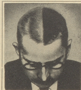
In dem hier beschriebenen Ex- periment wurde das Haar kurz geschnitten und in der Mitte ein Streifen ausrasiert. Während fünf Wochen wurde Silvikrin nur auf der linken Seite verwendet. Das Bild zeigt das Resultat: Zunahme des Haarwuchses um 35 Prozent.

Er wählte drei Männer mit normalem Haarwuchs als Versuchspersonen. Das Haar wurde bei allen kurz geschoren. In der Mitte des Kopfes wurde ein schmaler Scheitel ausrasiert, so daß beide Hälften voneinander getrennt waren. Die drei Männer kamen jeden Tag in die Sprech- stunde, um sich die linke Kopfhälfte mit dem Präparat einreiben zu lassen, wobei der Arzt Gelegenheit hatte, die Ent- wicklung zu verfolgen.