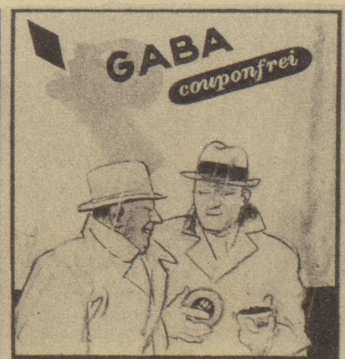
„Der Schirm ist gut, aber mir sind meine Gaba noch wichtiger. Bitte, bedienen Sie sich!“ Ob's windet, regnet oder schneit, Gaba schützt vor Heiserkeit!