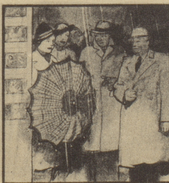
Freys und Flurys können den Heimweg zusammen antreten. Sie wohnen ja Tür an Tür.