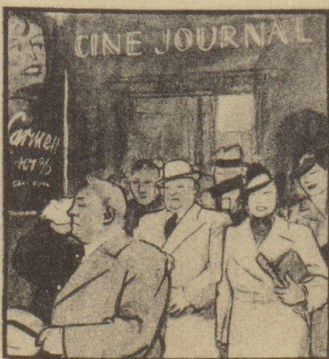
Die Kinobesucher sind noch ganz benommen von allem Gesehenen und von der Hitze im Saal. Draußen geht ein kalter Regen nieder.

Manch Fräulein tut nach langen Wegen Sich Rot auf Mund und Wangen legen.