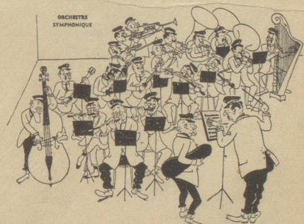
«Herr Kapellmeister, ich bin fertig; darf ich gehen?» Ric et Rac

Dreimal Au! «Hallo, ist dort Müller und Weber!» «Ja, was wünschen Sie?» «Sagt man Kleópatra oder Kleopátra?» «Wie sollen wir das wissen?» «Im Adreßbuch steht doch, daß Sie eine Beton-Firma sind!» ore