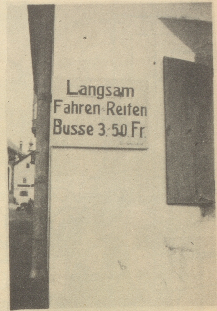
Da isch me schöö am Seil miteme alte Gaul!

Hei, ging da ein Aufschnauen durch die Mannen. Der Fourier schlug seine Absätze zusammen und kam mit seiner Schuhschachtel voll Sacksäcklein dahergerannt. Es ging nicht lange ... so hatte ich vier funkelnegeleue Fünfernötlein in der Hand. Jetzt aber los, wie die Kugel aus dem Rohr, zum nächsten Bäcker. Mit einem großen Sack voll Makrönli und Bretzeli und einem Nötlein weniger stieg ich bald wieder die ausgetretenen Stufen herunter und begab mich auf die Suche nach einem idyllischen Platz für meine Galgenmahlzeit. Diese wurde auf einer Holzbeige, plaziert zwischen einer Blumenwiese und einem Murbelbach, abgehalten. Genießerisch drückte ich die weißen, braunen und gelblichen Guetzli in