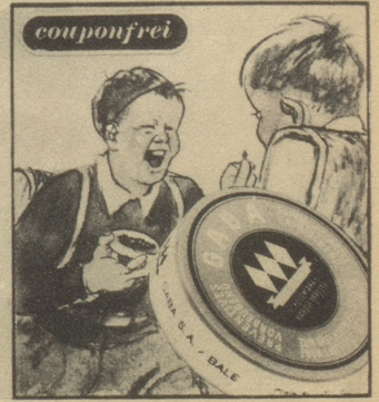
„Keine Angst, ich gebe dem Buben immer Gaba auf den Schulweg mit. Gaba schützt vor Husten und Heiserkeit.“