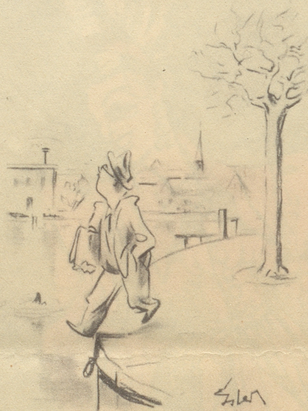
Gefahren aus der Luft

«Ein mächtiger Herzog wollte die Schweizer bekriegen. Er hielt mit seinen Räten Ratschlag, wie man die Sache anstellen sollte, daß man zu ihnen ins Land käme. Nun hatte der Herr einen kurzweiligen Narren, den fragte er auch scherzweise, was er dazu räte. Der Narr antwortete: Es gefällt mir garnicht. Ihr erratet alle, wie man hinein, und keiner, wie man wieder herauskommen möge. Es war dies eine gewisse Prophezeiung des Narren, denn der Herzog wurde mit den Seinen von den Schweizern erschlagen.» h.