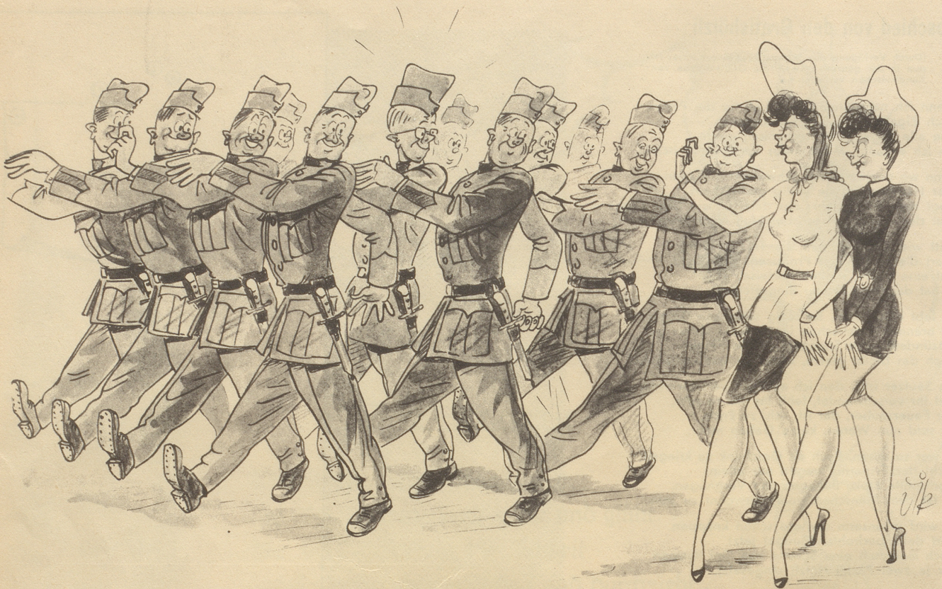
5. Bild aus Diks Kriegs-Skizzenbuch