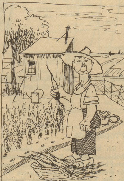
„Ich ha mis eige Gmües.“