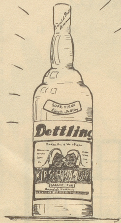
Arnold Dettling Brunnen

A. DÜRR & CO. AG. ZÜRICH Bahnhofstr. 69 „zur Trulle“ Bahnhofplatz 6