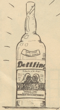
Arnold Dettling Brunnen

A. DÜRR & CO. AG. ZÜRICH Bahnhofstr. 69 „zur Trulle“ Bahnhofplatz 6