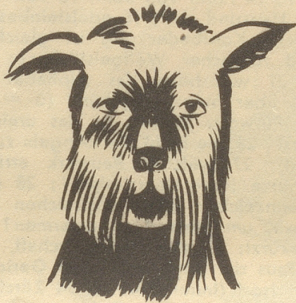
Alex heisst dies treue Hundetier.

«Oh, Mama — lueg: de säb Ma det hinkt mit em Chopf!» Boll.