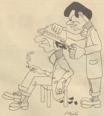
Das Neueste, der Guillotineschnitt, auch der Laie lernt ihn leicht

1 3 5 7 11 15 20 24 28 30 32 2 4 6 8 12 16 21 25 29 31 33 9 13 17 22 26 10 14 18 23 27 19