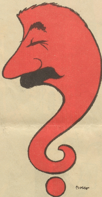
Das rote Fragezeichen

Nach einem noch unbestätigten Gerücht soll sich auch Winston Churchill in der Schweiz aufhalten. Jedenfalls glaubt man den einstigen Premier in