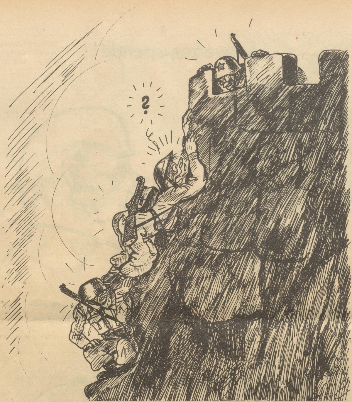
„Tschau mitenand, ich bi dänn hinte dure ine cho!“