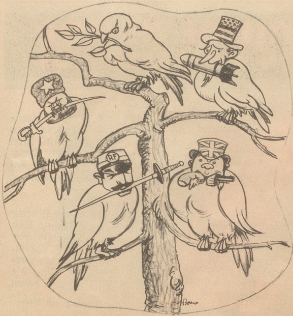
Tauben, lauter Tauben!